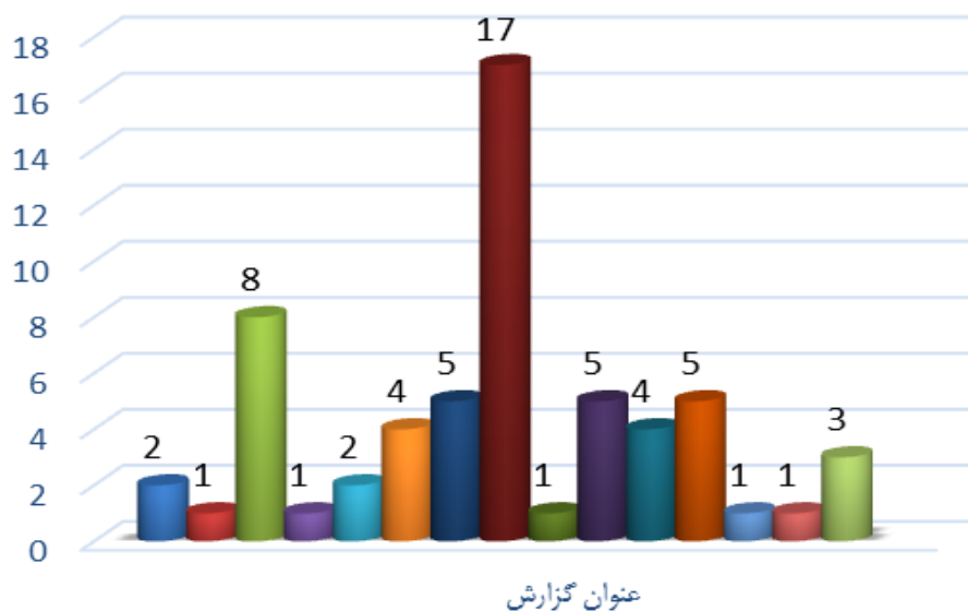
نمودار (۲): موضوعات فرعی آسیب‌های فرهنگی فضای مجازی