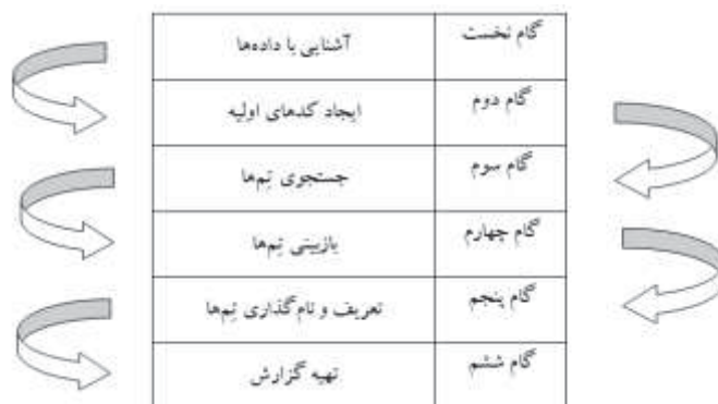
جدول (۱): مراحل تحلیل مضمون

به‌طور کلی می‌توان گفت تحلیل مضمون شیوه‌ای در روش پژوهش کیفی است که بر شناسایی، تحلیل و تفسیر الگوی معانی داده‌های کیفی تمرکز دارد. مضمون یا تم، عنصر کلیدی در این روش است. مضمون‌ها پرارزش‌ترین