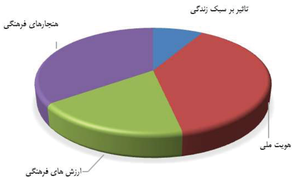
نمودار (۱): موضوعات اصلی آسیب‌های فرهنگی فضای مجازی